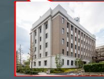
危機管理センター